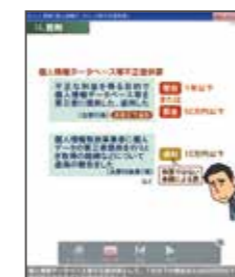
▲2-7節 罰則「個人情報データベース等不正提供罪」より