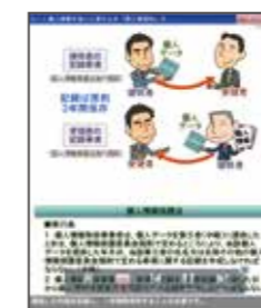
▲2-5節 個人情報を他人に渡すとき「第三者提供」②より