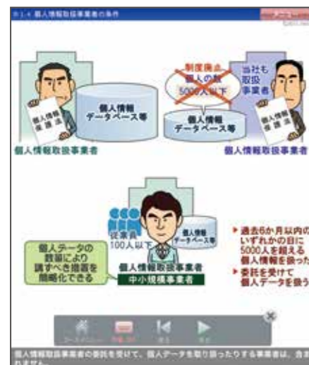
▲1-4節 個人情報取扱事業者の条件より

6か月以内の取り扱い件数の条件(5000人要件)が廃止され、個人情報を取り扱う事業者は対象になります。