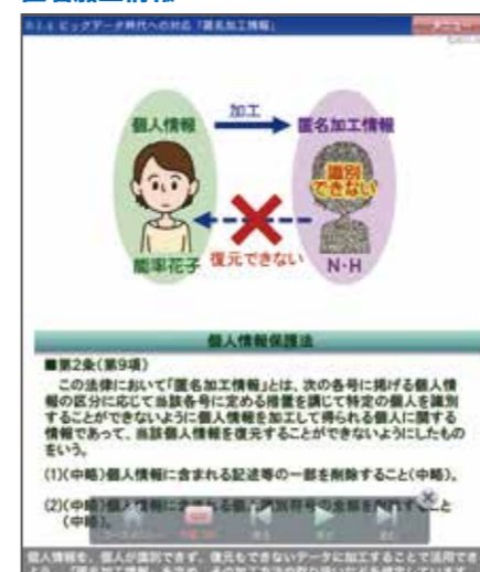
▲2-8節 ビッグデータ時代への対応「匿名加工情報」より