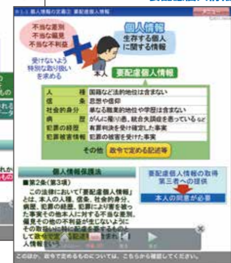
▲1-3節 個人情報の定義② 要配慮個人情報より