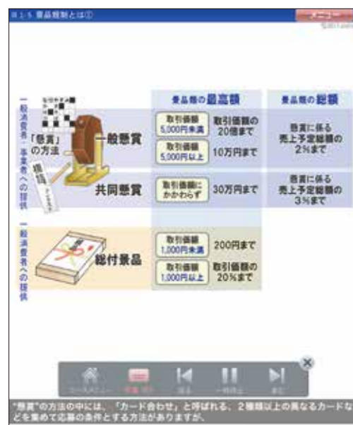
▲ 1-5 景品規制とは① より

景品 1 景品の規制内容とは？ 景品は、その提供方法に応じて、景品の総額や最高額などが規制されます。