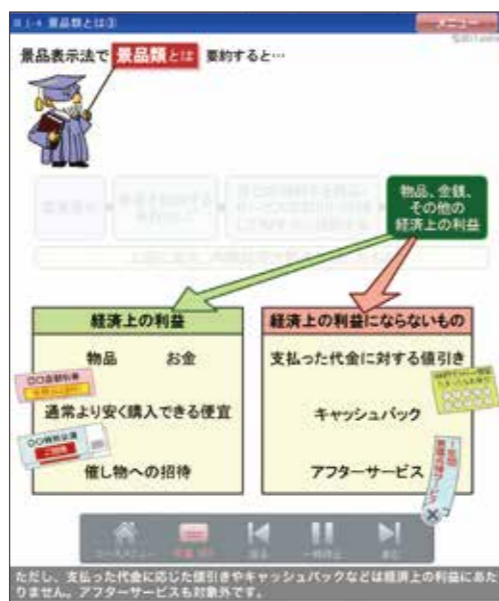
▲ 1-4 景品類とは③ より

景品 2 抽選による金品の提供だけが「景品」ではありません！ 金品に限らず「経済上の利益」の提供を行えば「景品類」に該当する場合があります。