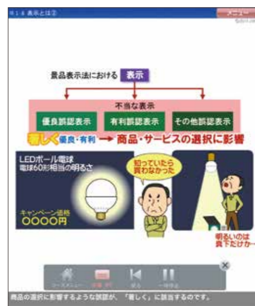
▲ 1-8 表示とは② より

表示 2 「不当表示」となる判断基準とは？ 事業者の意図・見解ではなく、消費者が表示全体から受ける印象で判断されます。