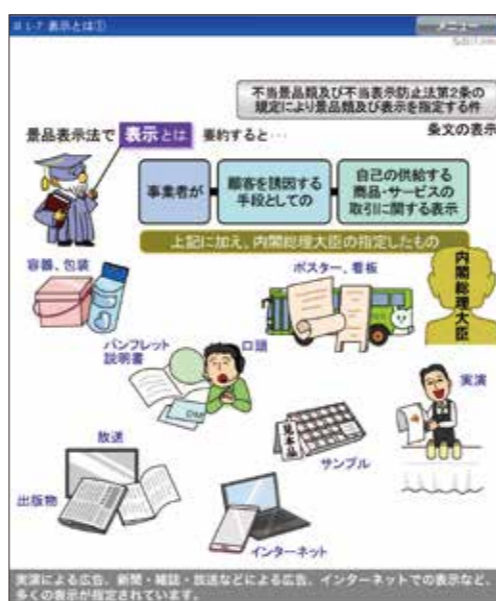
▲ 1-7 表示とは① より

表示 1 CM、チラシ、ポスターなど広告以外にも規制対象となる「表示」がたくさんあります！ 商品・サービスの説明書、容器や営業のセールストークなど、お客様の購入の判断となる商品・サービスの取引に関する「表示」は規制対象となります。