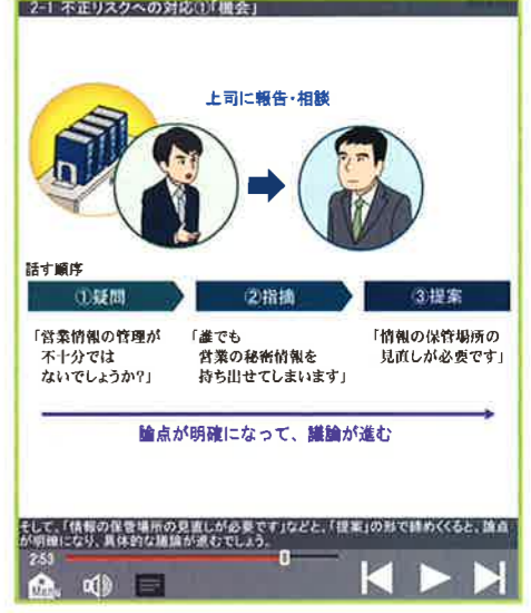
▲ 2-1 不正リスクへの対応①「機会」 より