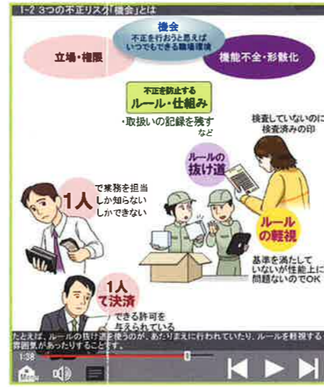
▲ 1-2 3つの不正リスク「機会」とは より