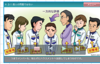
▲職場ハラスメント対応コース